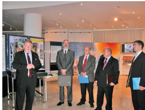
Povești de succes: 0